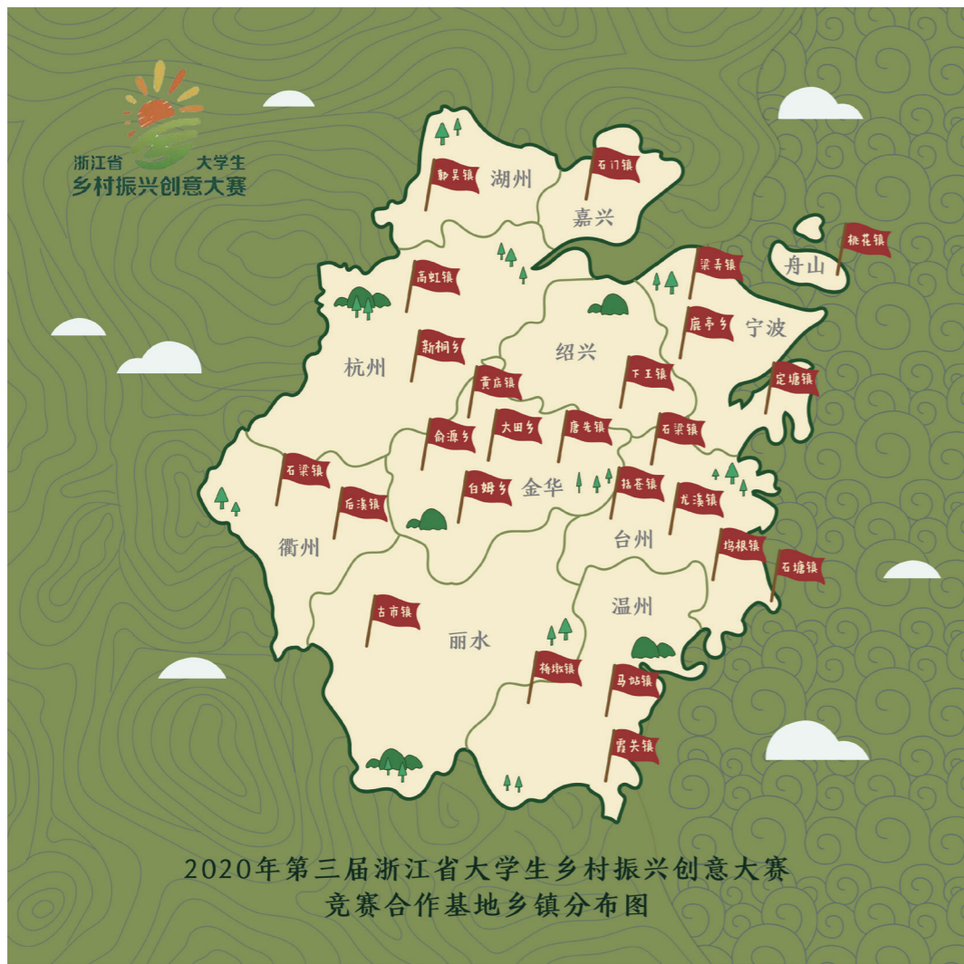
“农信杯”第三届浙江省大学生乡村振兴创意大赛 竞赛合作基地乡镇分布图